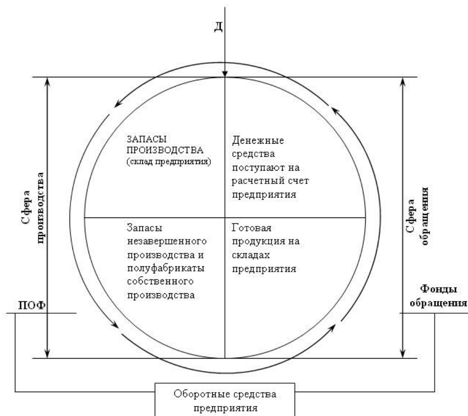
Рисунок 2 – Схема кругооборота ОС

Величина оборотных средств, занятых в производстве, определяется в основном: